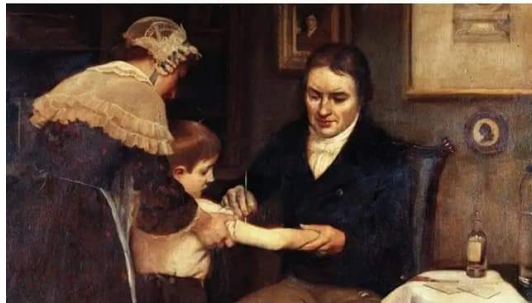
Edward Jenner performing his first smallpox vaccination on a child in 1796.